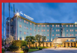
BEST WESTERN HOTEL TURISMO VERONA