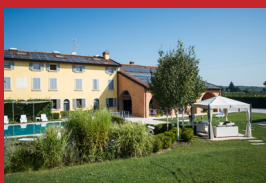
HOTEL CORTE DEL PAGGIO