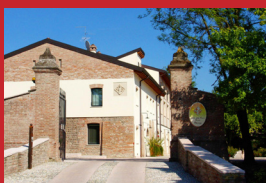
CORTE DELLA ROCCA