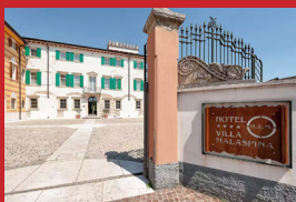
HOTEL VILLA MALASPINA