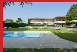
HOTEL VENEZIA PARK