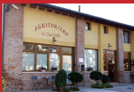
AGRITURISMO AI DUE VOLTI