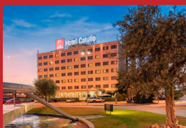
SHG HOTEL CATULLO