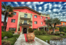
LA GROTTA HOTEL