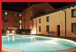
AGRITURISMO CORTE CASTELLETTO