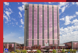
MONTESOR HOTEL TOWER