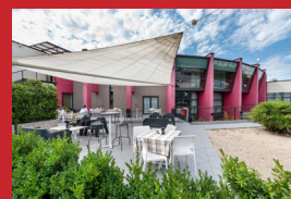
DB HOTEL VERONA