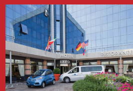
BEST WESTERN PLUS HOTEL EXPO VILLAFRANCA DI VERONA