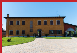
AGRITURISMO BACCHE DI BOSCO