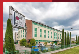
WEST POINT AIRPORT HOTEL